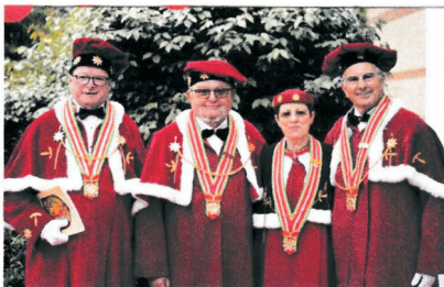
LE BUREAU DE L'ORDRE ÉLU À L'ASSEMBLÉE GÉNÉRALE

Après un apéritif sur la terrasse de l'Hôtel Mercure et devant un magnifique coucher de soleil, quoi de plus festif et de plus anysetier que la très belle et très conviviale soirée de gala qui fut offerte.